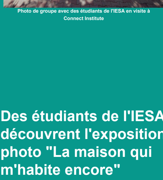
Photo de groupe avec des étudiants de l'IESA en visite à Connect Institute