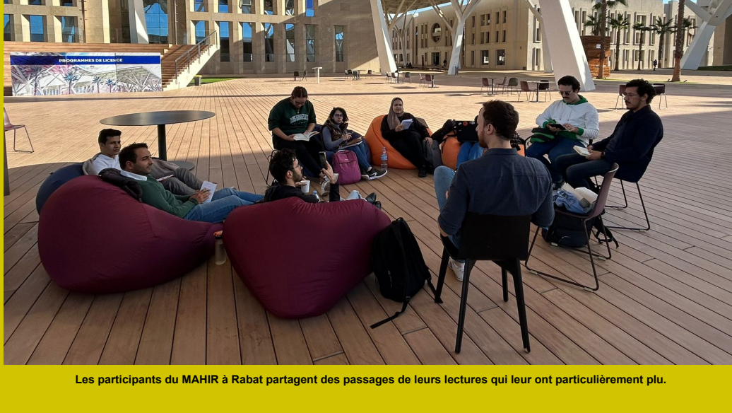
Les participants du MAHIR à Rabat partagent des passages de leurs lectures qui leur ont particulièrement plu.

Après un QRAYATHON de 3 heures le vendredi 11 novembre 2023 à l'UM6P Rabat, les participants se sont rassemblés sous la pergola, munis de leurs livres et blocs-notes, pour discuter de leurs lectures. La session a débuté par un partage en tour de rôle des extraits marquants de leurs lectures, suivi de discussions visant à contextualiser les livres en question. L'objectif de cette séance était d'explorer de nouveaux titres, de bénéficier des expériences de lecture des autres participants, tout en ajoutant une nouvelle dimension au QRAYATHON et en encourageant la pratique de la lecture.