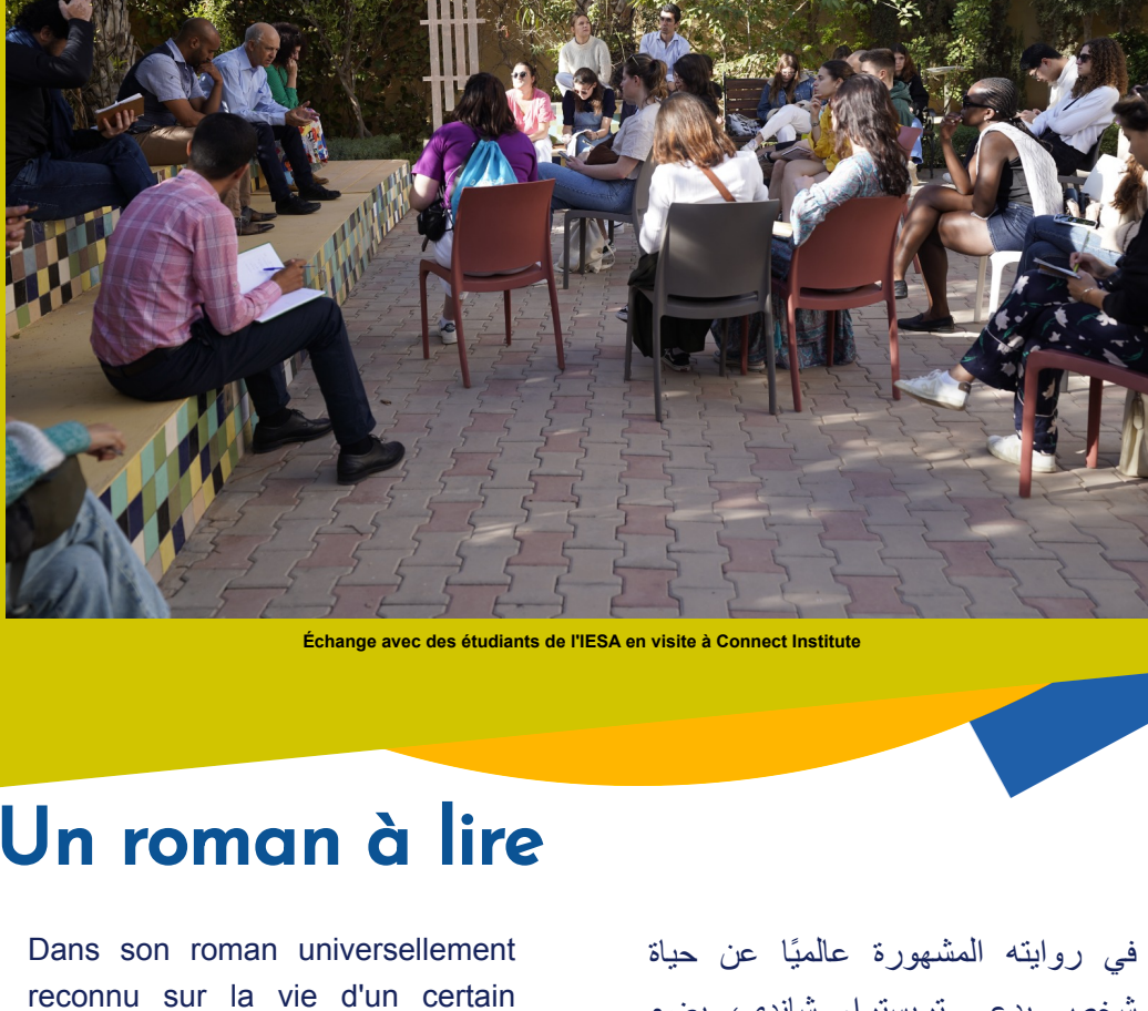
Echange avec des étudiants de l'IESA en visite à Connect Institute