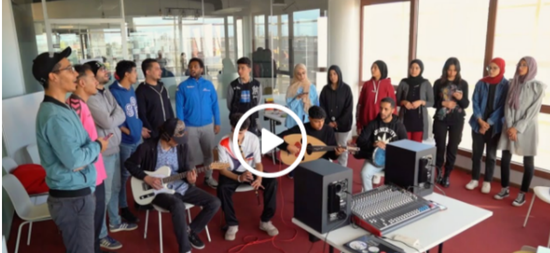
Vidéo teaser de l'événement "NKOUN"

Soyez au rendez-vous pour un moment d'apprentissage, de plaisir et de découverte !