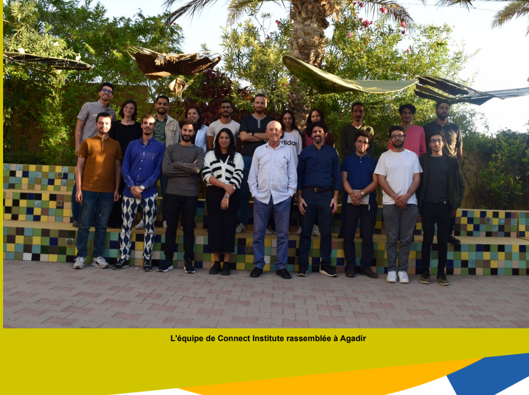
L'équipe de Connect Institute rassemblée à Agadir