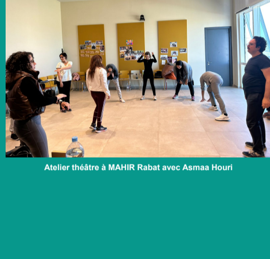
Atelier théâtre à MAHIR Rabat avec Asmaa Hourri

Les participants du MAHIR Center Rabat ont entamé le travail sur le thème de l'événement NABNI #5 à travers divers ateliers. Le mardi 14 novembre 2023, la journée a été dédiée à la collaboration avec la célèbre dramaturge Asmaa Hourri afin de créer des scènes captivantes reflétant leurs perspectives sur le thème de cette année.