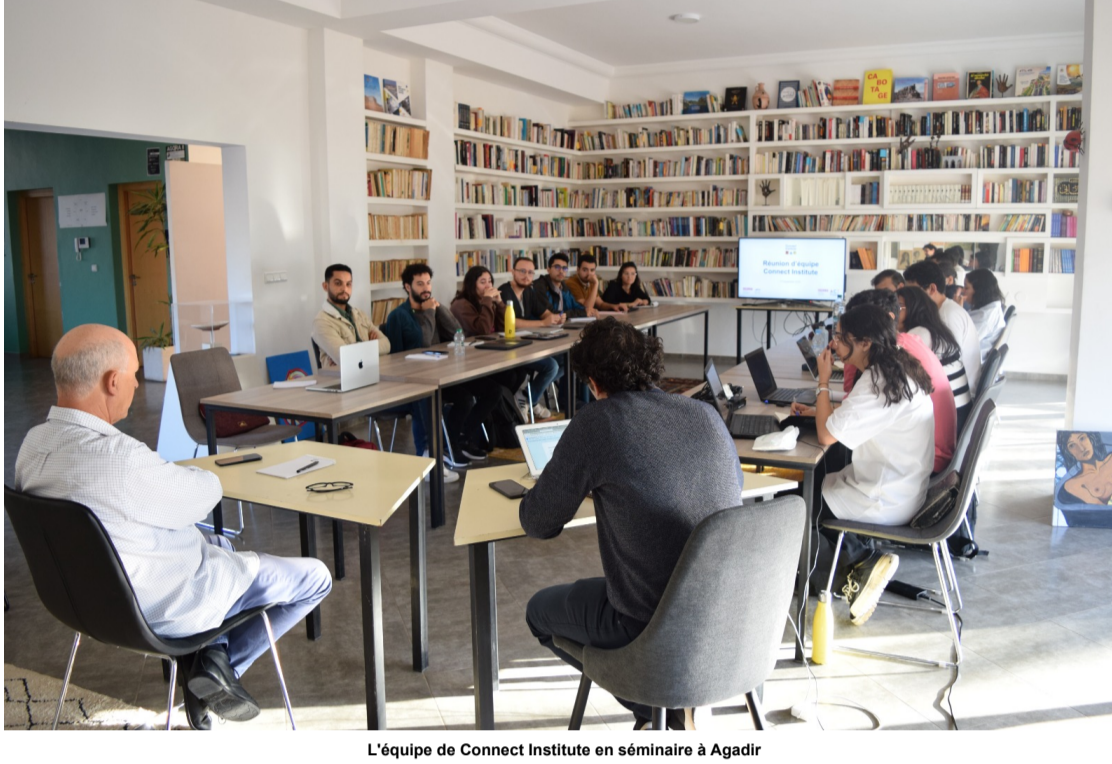
L'équipe de Connect Institute en séminaire à Agadir

Le 17 novembre 2023 est la date qui a réuni les 20 collaborateurs et membres de l'équipe Connect Institute à Agadir. Les coordinateurs des différents centres appartenant à l'écosystème Connect Institute et MAHIR Network se sont rassemblés pour échanger autour de sujets concernant la mission de l'équipe.