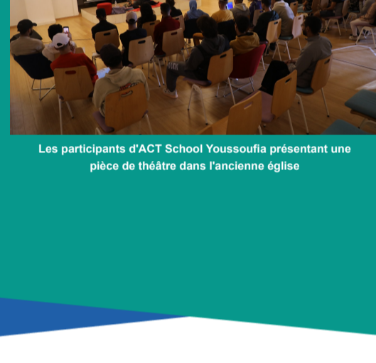
Les participants d'ACT School Youssoufia présentant une pièce de théâtre dans l'ancienne église