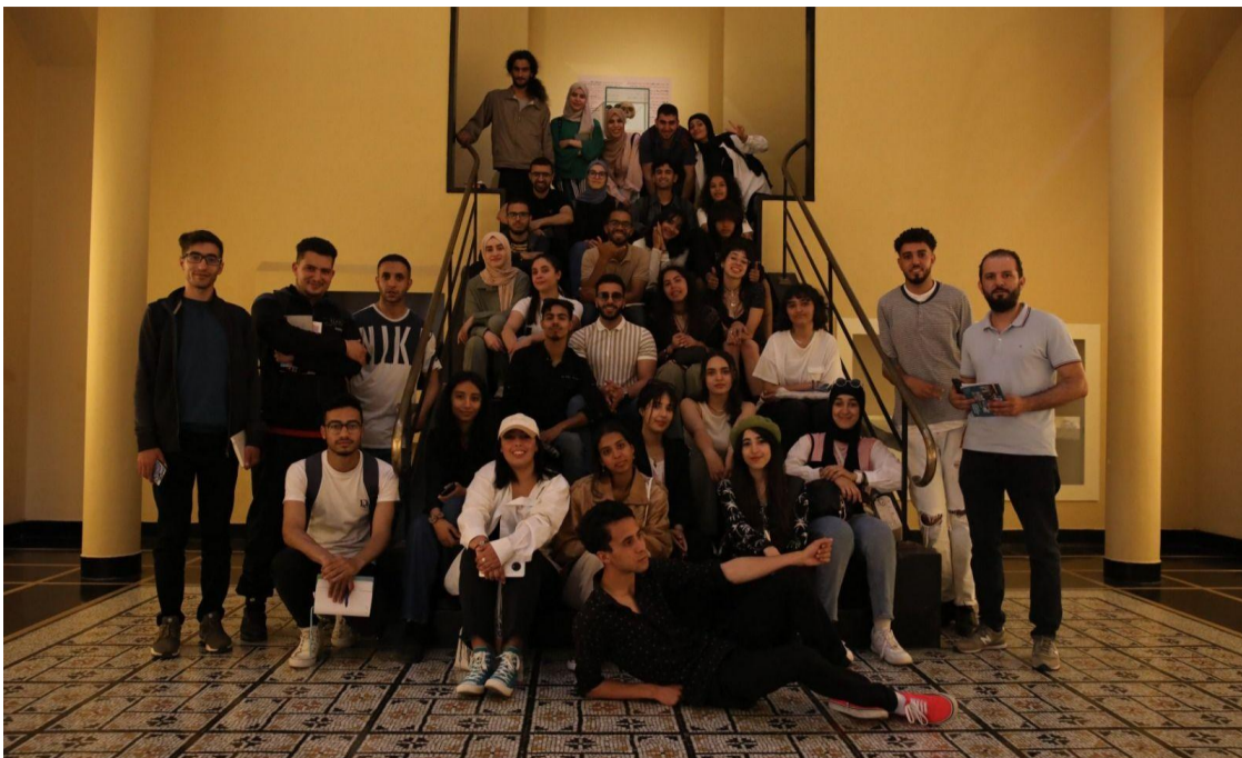
Des jeunes des centres ACT School Khouribga et El Jadida en visite au Musée d'Histoire et des Civilisations à Rabat