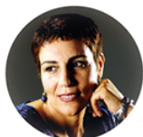
Touria Hadraoui Artiste Chanteuse