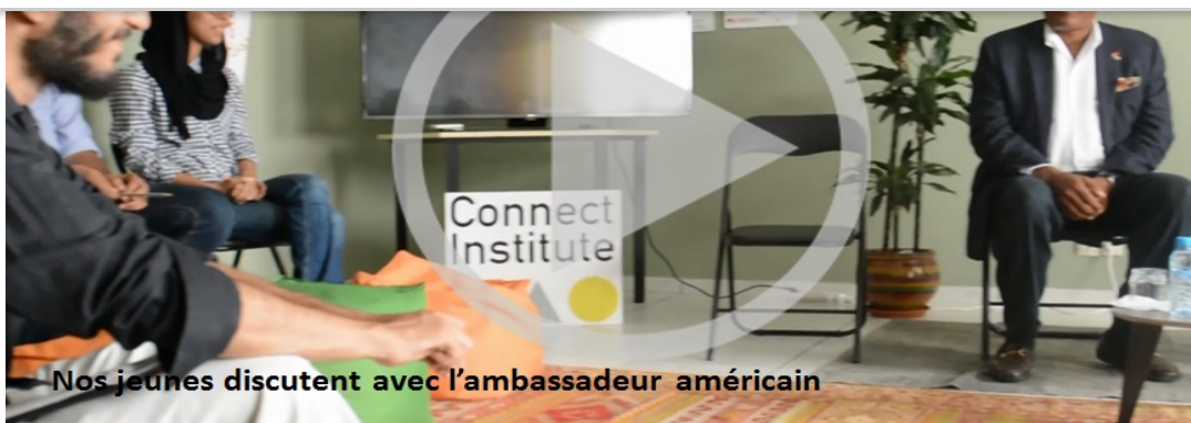
Nos jeunes discutent avec l'ambassadeur américain