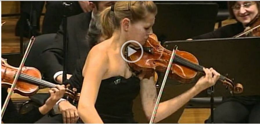
Camille Saint-Saëns 1835 Paris - 1921 Alger