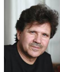
Abdelwahab Meddeb (1946 Tunis - 2014 Paris)

Voici l'enregistrement de sa dernière chronique donnée le 24 octobre sur France Culture: La haine de la culture .