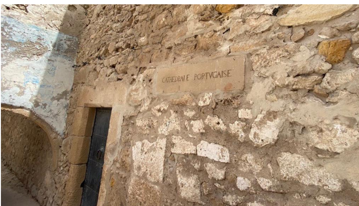
La Cathédrale portugaise de Safi désespérément fermée !

Les métaphores, les paraboles sont souvent employées pour faciliter la compréhension de certains mystères de la vie. Elles nourrissent les récits et les littératures. Elles ne sont pas toujours destinées à être prises à la lettre. Le Coran les utilise abondamment pour instruire les humains. Tout en avertissant sur la différenciation dans leur compréhension. Voici un exemple :