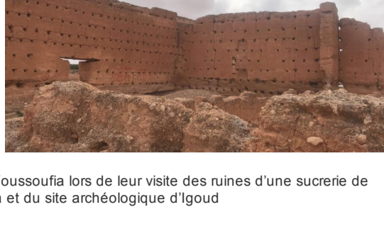
Photos prises par un groupe d'apprenants à ACT School Youssoufia lors de leur visite des ruines d'une sucrerie de l'époque des Saadiens à Chichaoua et du site archéologique d'Igoud

De tout temps, les impôts sont prélevés sur l'argent et les biens pour faire fonctionner l'Etat. Mais aussi pour redistribuer les richesses.