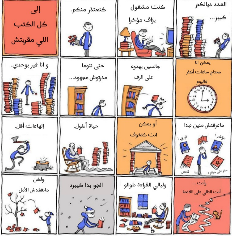
Grant Snider New York Times 22/12/21

Cette illustration est une invitation à renouer avec la lecture. Fixons-nous donc un objectif en cette nouvelle année : lisons les livres que nous n'avons jamais ouverts, finissons ceux que nous n'avons réussi à finir !