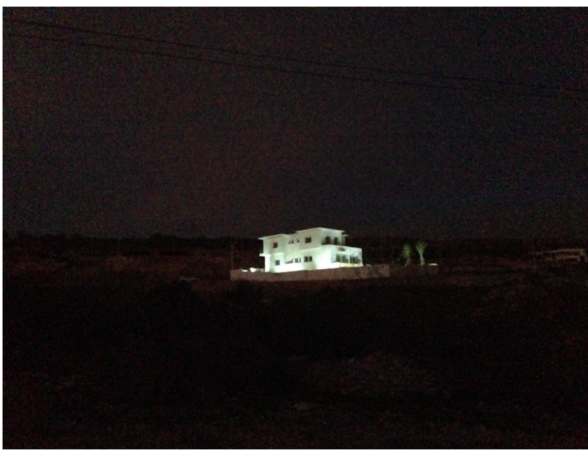
Les locaux de Connect Institute Agadir en 2016

En passant devant un beau bâtiment, en fin de journée, il m'arrive de constater combien son parking déborde de voitures. C'est le bâtiment qui abrite un lieu d'exercice physique et sportif. Depuis quelques années, de plus en plus de gens ont pris l'habitude de prendre soin de leur corps et d'y consacrer du temps et de l'argent. Depuis plus de deux mille ans, une maxime est largement répandue : "Un esprit sain dans un corps sain."