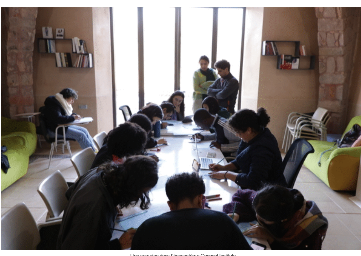
Une semaine dans l'écosystème Connect Institute

Un jour du temps des années de plomb au Maroc, la mère d'un prisonnier politique rencontre une personne pauvre et défavorisée qui lui dit : "Mais pourquoi donc votre fils se mêle-t-il de politique ? Il ne lui manque rien pour vivre confortablement."