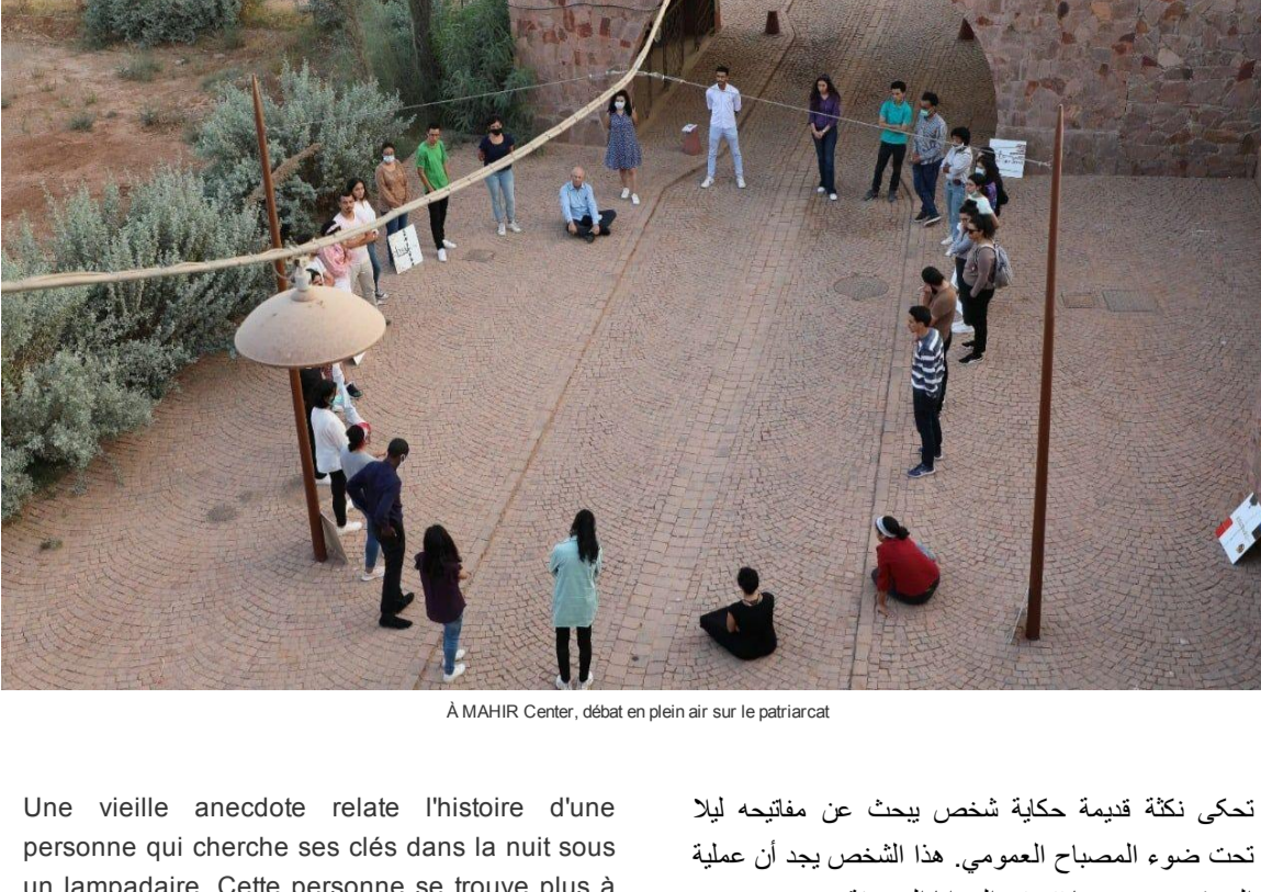
A MAHIR Center, débat en plein air sur le patriarcat

Une vieille anecdote relate l'histoire d'une personne qui cherche ses clés dans la nuit sous un lampadaire. Cette personne se trouve plus à l'aise pour chercher là où il y a l'éclairage.