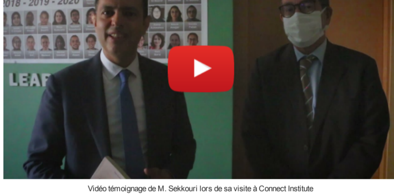
Vidéo témoignage de M. Sekkouri lors de sa visite à Connect Institute

M. Sekkouri, Ministre de l'Inclusion économique, de la Petite entreprise, de l'Emploi et des Compétences, s'est rendu à la Villa Connect, accompagné de plusieurs membres de son cabinet ainsi que de M. le Wali de la région Souss Massa.