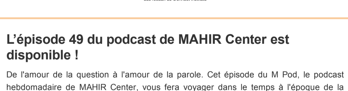
Les locaux de Connect Institute

Enfin, ils ont été invités à mettre leurs créativité et leurs talents à l'épreuve à travers un atelier de cuisine sur la préparation d'omelette, une compétition de storytelling, une séance d'arts manuels ainsi qu'une soirée artistique qui a été organisée le samedi 23 octobre.