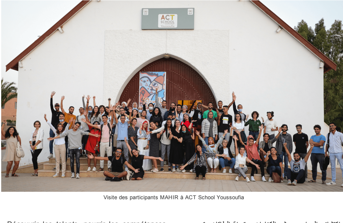
Visite des participants MAHIR à ACT School Youssoufia

Découvrir les talents, nourrir les compétences, rassembler les énergies, libérer les potentiels ... Des mots ? Des slogans ? Non, c'est une réalité. Et cela se passe à Youssoufia. Des œuvres d'art, des repas de qualité, des expressions culturelles diversifiées, de l'imagination, du travail en groupe. C'est ce à quoi ont assisté adultes, jeunes et familles dans un ancien lieu de culte transformé en lieu de culture. Lors de l'exposition de ces travaux, les nouveaux participants des centres MAHIR, de Rabat et de Benguerir, ont partagé la joie, la fierté et l'espoir des jeunes de ACT School Youssoufia. Le public est à chaque fois plus nombreux. La dynamique est en marche. Cela prend du temps. Et la volonté et la persévérance sont là !