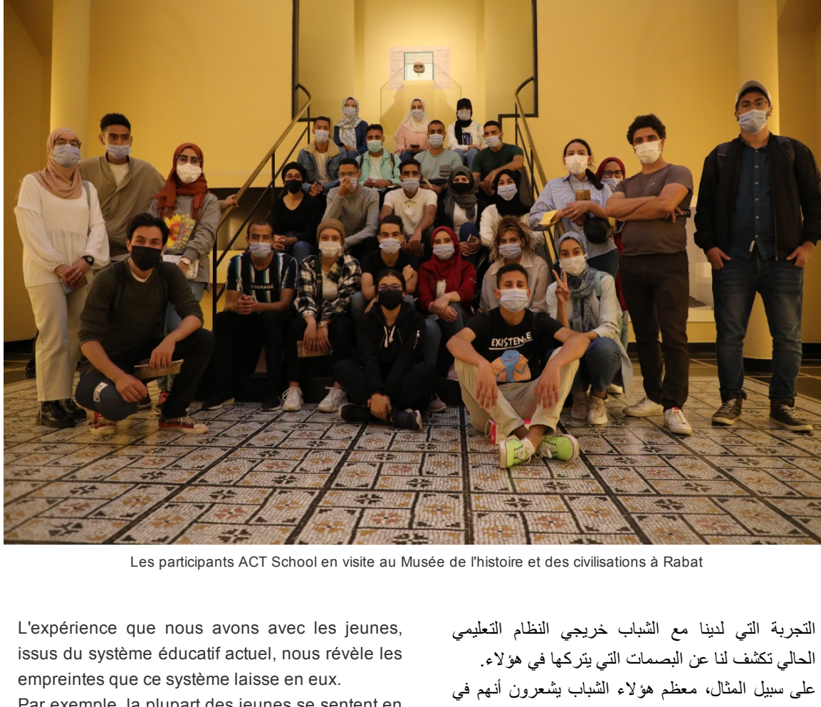
Les participants ACT School en visite au Musée de l'histoire et des civilisations à Rabat

L'expérience que nous avons avec les jeunes, issu du système éducatif actuel, nous révèle les empreintes que ce système laisse en eux. Par exemple, la plupart des jeunes se sentent en attente de quelque chose qui devrait arriver pour leur vie. Ou alors, ils pensent qu'ils doivent courir derrière des carrières, pas toujours adaptées pour eux. Nous essayons de notre côté de les accompagner pour qu'ils se cultivent, qu'ils développent leur compréhension du monde et qu'ils incarnent les compétences recherchées. Exactement comme le résume joliment l'écrivain brésilien Mario Quintana : "Le secret, ce n'est pas de courir après les papillons. Mais d'avoir soin de ton propre jardin afin que les papillons puissent venir d'eux-mêmes vers toi."