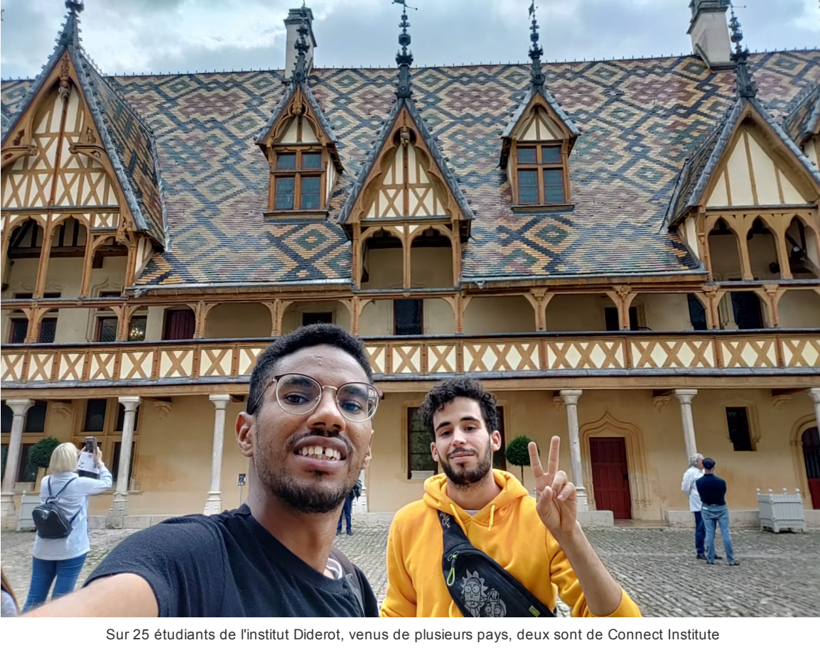
Sur 25 étudiants de l'Institut Diderot, venus de plusieurs pays, deux sont de Connect Institute

Il y a quarante ans, pour passer un appel téléphonique, de chez soi, à la poste ou même de chez l'épicier du coin, il fallait attendre la tonalité avant de composer le numéro. Une attente qui pouvait durer des heures.