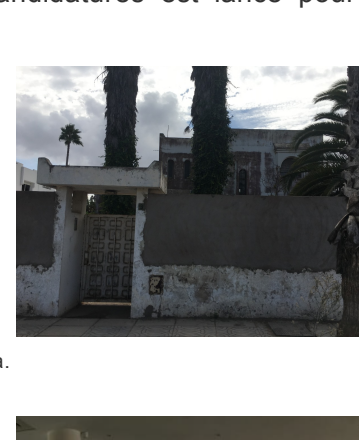
Repérage des locaux d'ACT School El Jadida.