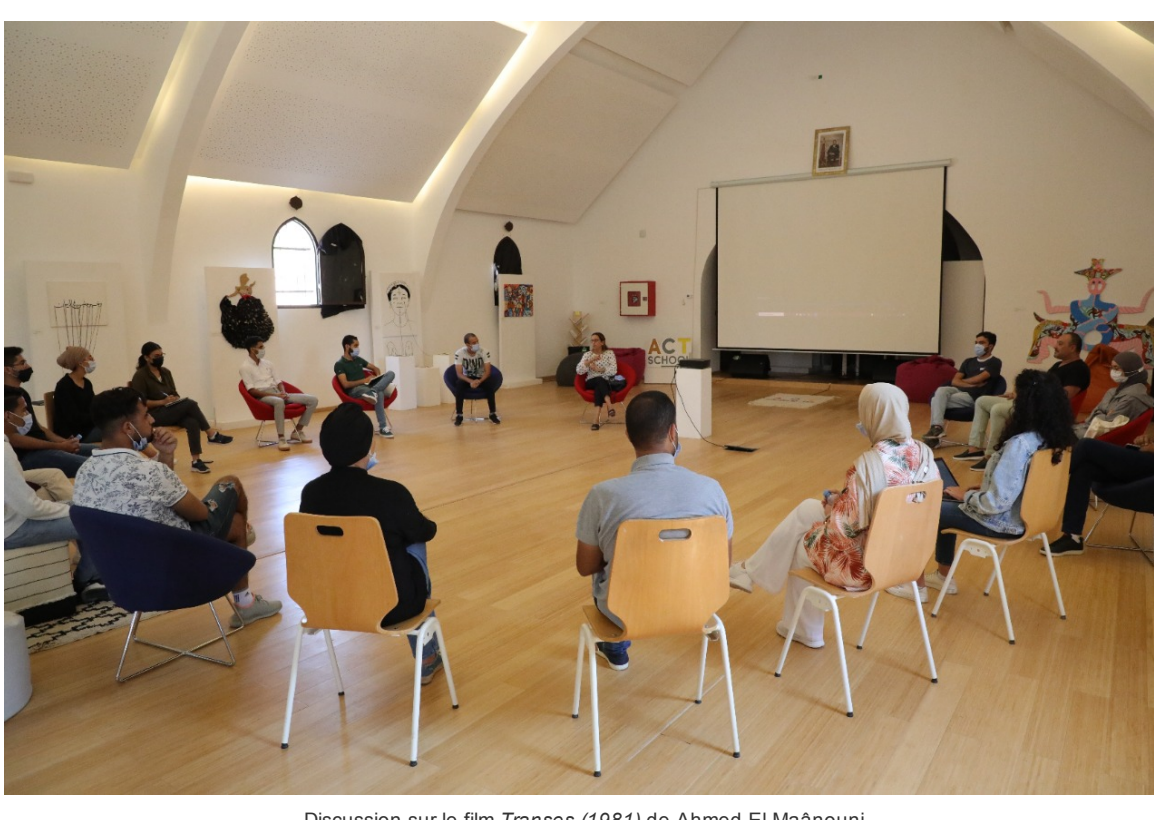
Discussion sur le film Trances (1981) de Ahmed El Maânouni

Il lit beaucoup. Cela l'aide énormément. Cela lui permet de mieux réussir.