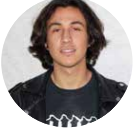
By Youness Akherzi