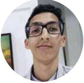
By Yassine Oulhiq

!استجمعت شجاعتني و صرخت بكل ما أتيت من قوة، اصمتوا هدأ الضجيج، شهيق، زفير. اتصلوا بالاسعاف، افعلوا شيئاً. عدت الى الشاب الذي بدأ يفرز فمه زبدة بيضاء، بدأ قلبي يخفق بشدة أحسست وكأنه داخل خلاط كهربي.