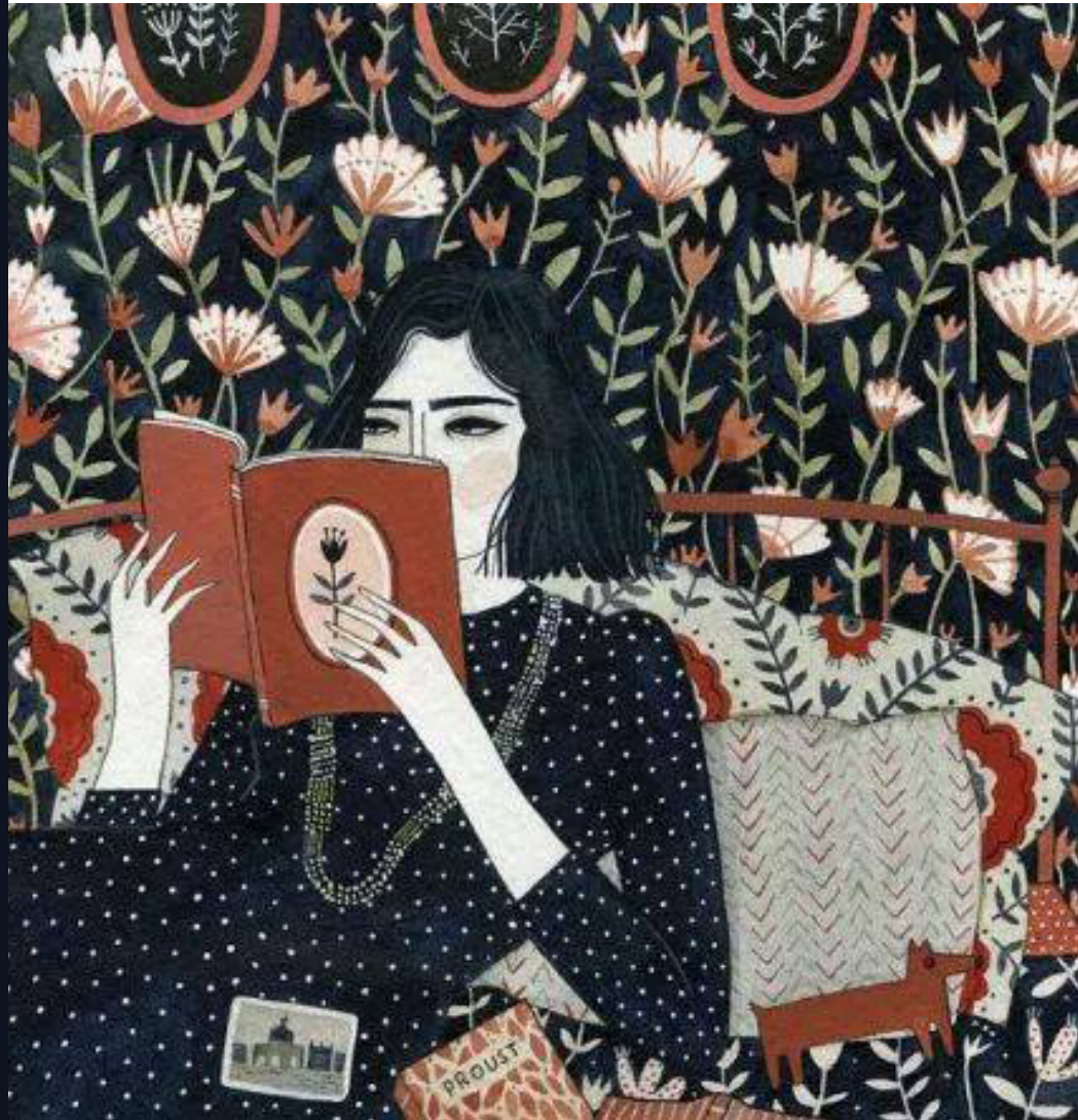
Illustration by : Yelena Bryksenkova.