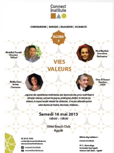
AGORA 3 16 mai 2015