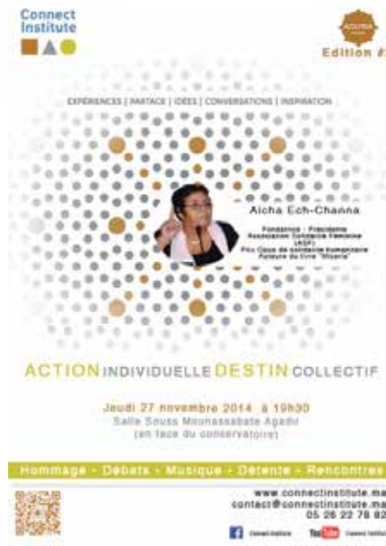
AGORA 2 27 novembre 2014