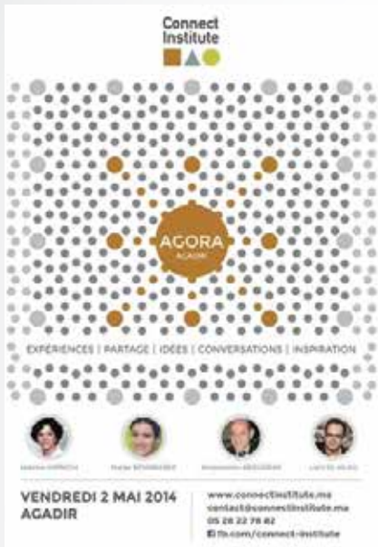
AGORA 1 02 mai 2014