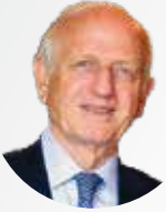
André Azoulay | Intellectuel, économiste, homme politique Conseiller de SM le Roi

« Je suis très frustré de ne pas être parmi vous à Agadir pour cette rencontre.