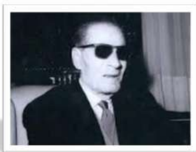
Taha Hussein 1889 -1973

”السعادة هي ذلك الاحساس الغريب الذي يراودنا حينما تشغلنا ظروف الحياة عن أن نكون أشقياء“